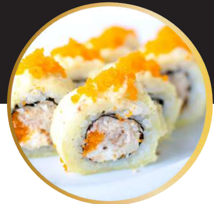
MASAGO ON FIRE 7.150 Tártaro de Jaiba, queso crema y sésamo, cubierto por un crujiente batido y masago.