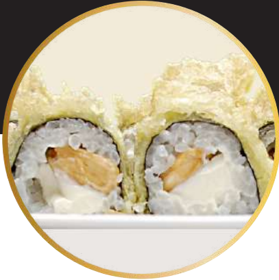
HOSOMAKI TEMPURA 3.950 Almendras tostadas y queso crema, tempurizado y bañado en salsa Unagi.