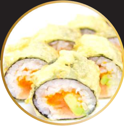
SAMURAI MAKI 4.950 Hosomaki de salmón, masago y palta, bañado en salsa Unagi.