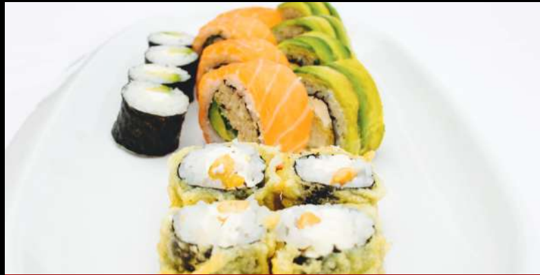
TABLA 16 PIEZAS 8.250

4 piezas Cangre 4 piezas Avocado Cream 4 piezas Hosomaki Tempura 4 piezas Kibou