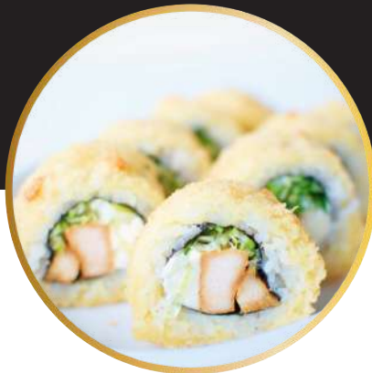
NEW ROLL 5.500 Pollo teriyaki, queso crema y cebollín, cubierto con Panko.