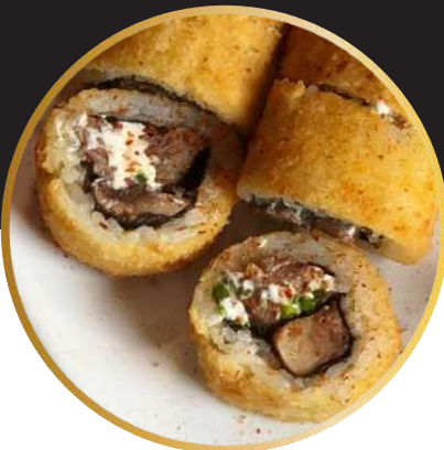
OKAMI 8.450 Queso crema, champiñón, filete, ciboulette y un toque de merquén, cubierto en panko.