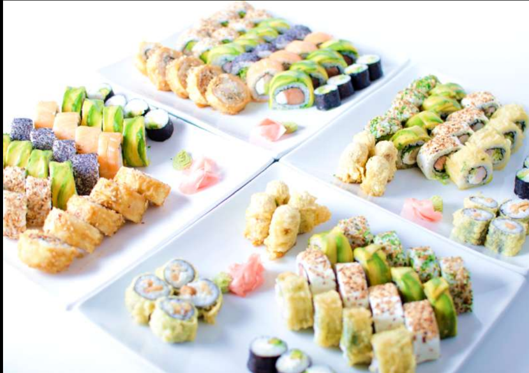
TABLA 132 PIEZAS 64.950