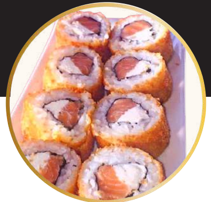
SUKI 5.600 Salmón y queso crema, cubierto con panko.