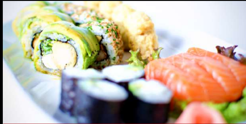
TABLA 20 PIEZAS 10.350

4 piezas Cangre 4 piezas Avocado Cream 4 piezas Hosomaki Tempura 4 piezas Kibou