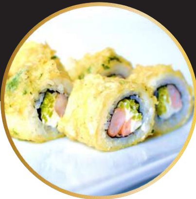
SEXY 5.750 Camarón ecuatoriano, queso crema, ají verde con tempura albahaca.