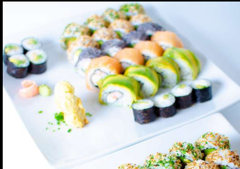
TABLA 65 PIEZAS

9 piezas Cangre 10 piezas Ebi Tori Tempura 9 piezas Kibou 4 piezas Nigiri Hot