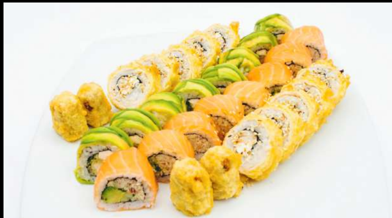
TABLA 32 PIEZAS 17.900

4 piezas Avocado Cream 4 piezas Teriyaki 4 piezas Kibou 4 piezas Nigiri Hot 4 piezas de Sashimi Salmón