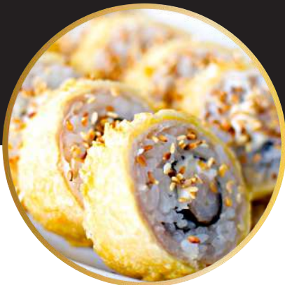
EBI TORI TEMPURA 6.550 Camarón ecuatoriano y queso crema, envuelto en pollo tempura, bañado en salsa teriyaki y sésamo.