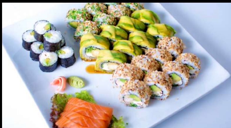
TABLA 39 PIEZAS 19.750

9 piezas Teriyaki 9 piezas Cream Cheese 9 piezas Pipe 9 piezas Ebi Cream