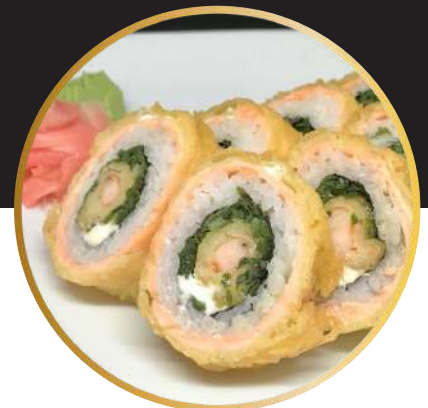
ROLLS ROYCE 8.200 Camarón ecuatoriano tempura, queso crema y cebollín, envuelto en salmón y cubierto en panko.